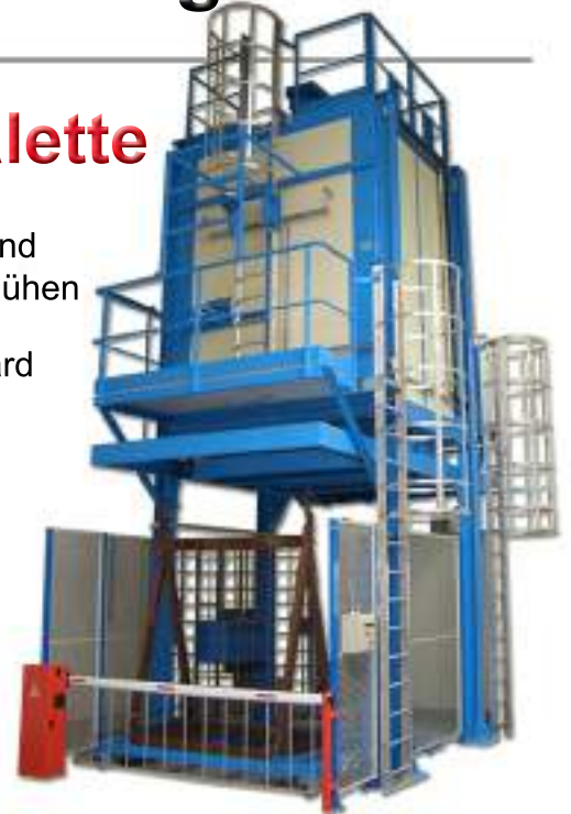
Härteöfen mit Vertikalbeschickung

Luftfahrt, Raumfahrt, Automobil, Schienenfahrzeug, elektrische Konstruktionen, Hüttenbetriebe & Gießereien, Freizeit (...)