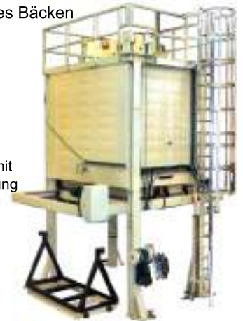
Lösungsglühofen mit vertikaler Beschickung