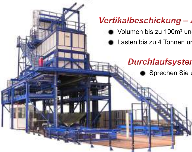
Bi-Labor Abschreckofen Länge 14m - Höhe : 16 m