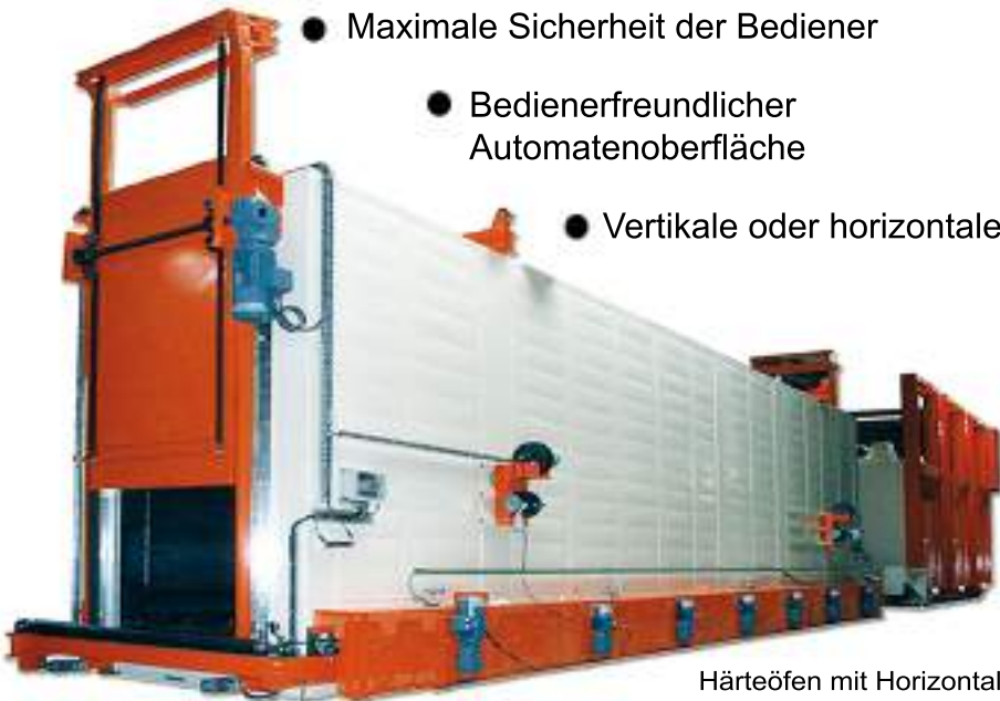
Härteöfen mit Horizontale Beschickung