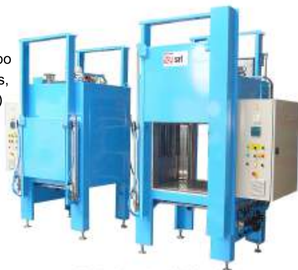
Estufa sobre pies: 350°C – 420 L Puertas guillotinas